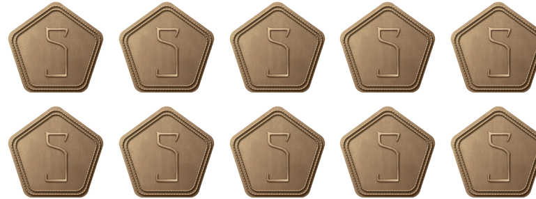
JETONS 5 POINTS DE VIE