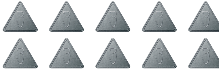
JETONS 3 POINTS DE VIE